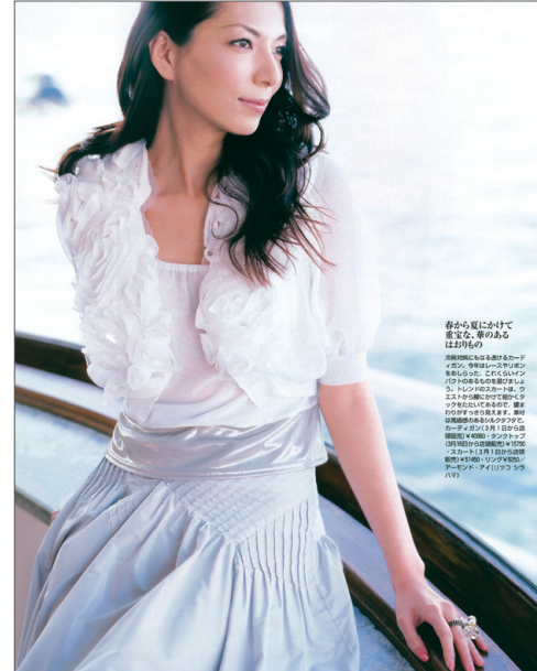
height 176 bust 82 waist 60 hips 88 shoes 25 hair dk.brown eyes dk.brown

春から夏にかけて 重宝な、春のある はありの この時期にふさわしい、軽やかなロープ マント。半袖はレースとシルクを 取り入れた、こっくりとした プリントのあるお洒落なシル ク。トレンドカラーの白。ラ ンタもふたに合わせることで、華 やかな印象になります。素材 は高級感のあるシルクで、 カラーはさわやかな白。全 長は170cm。タクトップ 170cm。袖丈は55cm。裾 スカートの長は110cm。裾 幅は100cm。サイズはS、M、 L、XL。アイリスカラー は白。