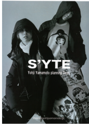
S'YTE Yohji Yamamoto planning Dept.