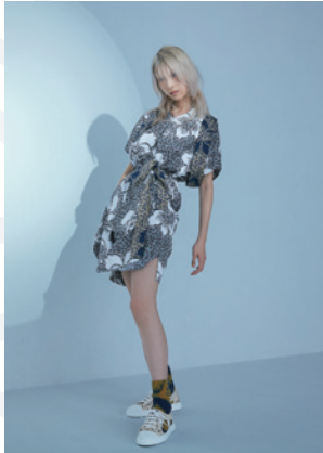
Vivienne Westwood Red Label