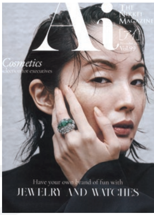
THE NIKKEI MAGAZINE AI